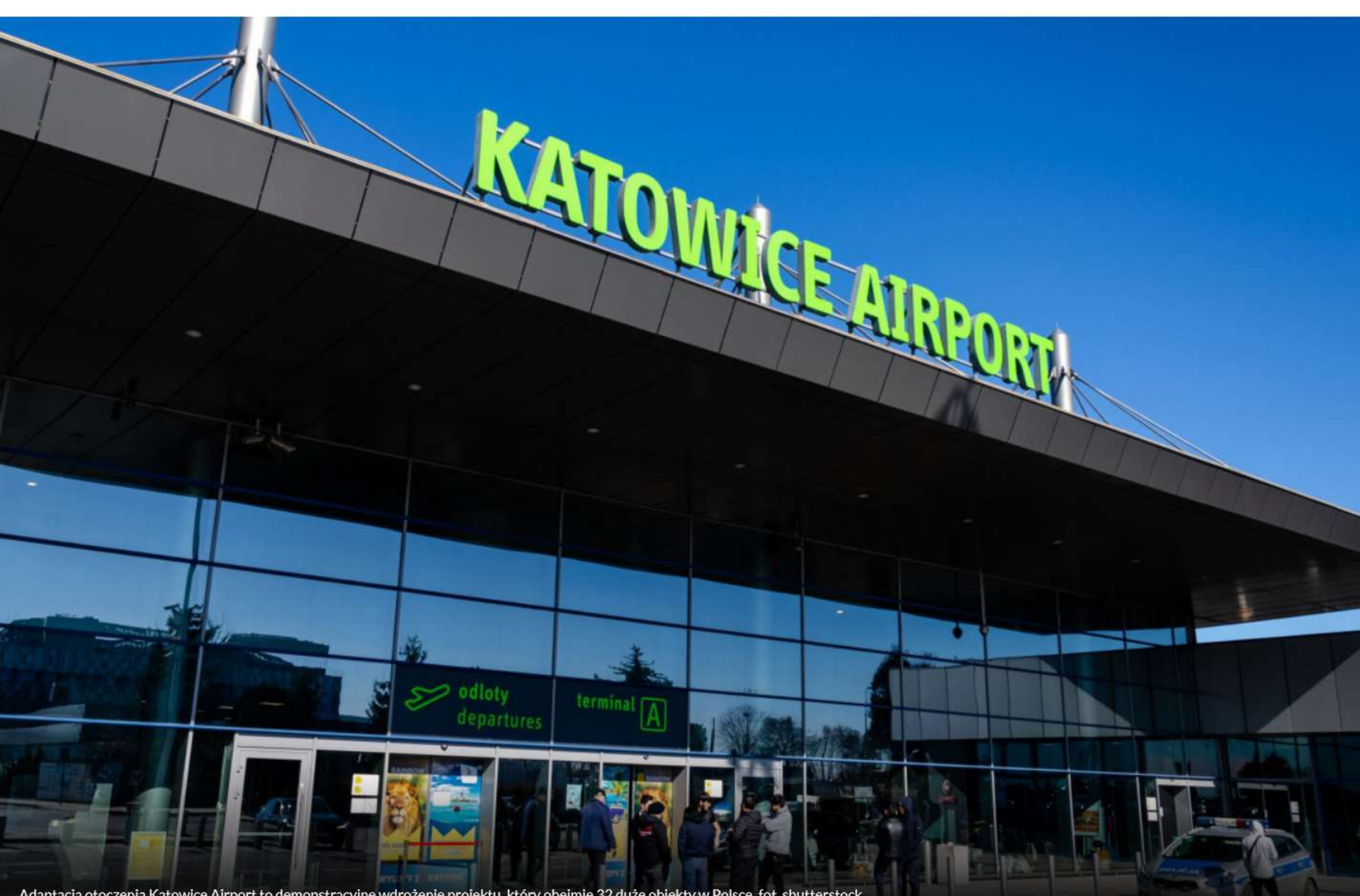
Adaptacja otoczenia Katowice Airport to demonstracyjne wdrożenie projektu, który obejmie 32 duże obiekty w Polsce

Autor: PAP Źródło: PAP Opublikowano: 06 sie 2024 14:57