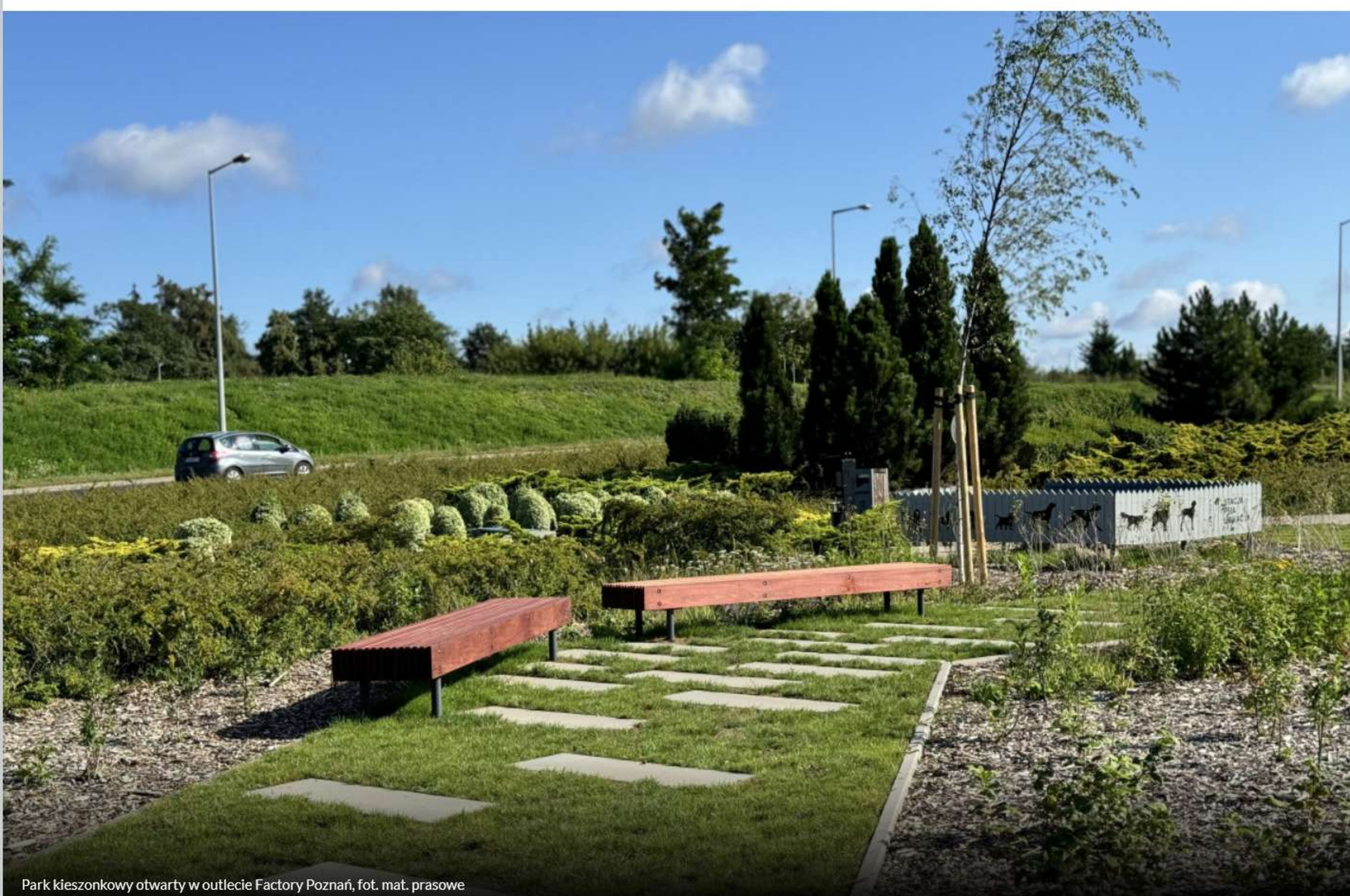
Park kieszonkowy otwarty w outlecie Factory Poznań, fot. mat. prasowe

Autor: Anna Solomiewicz | Źródło: PropertyDesign.pl | Opublikowano: 12 sie 2024 14:58 | Zaktualizowano: 13 sie 2024 10:09