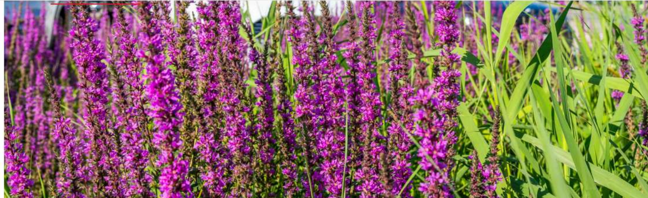
Zielona adaptacja lotniska w Pyrzowicach.